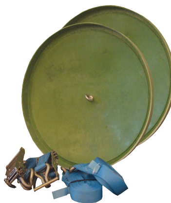
RSK nr. 563 6122

Tankar över 4m 3 förankras med jordankare. Ett set består av 2 st. Ø 600 mm glasfiberlock med 1 st förankringsband 8 m. Se monteringsanvisningar för antal förankringsset per tank.