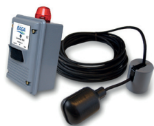
RSK nr. 563 2673

En nivåvipa styr larmenheten. Vid larmsignal avger BLS enheten både ljud och ljuslarm. Nätanslutning.