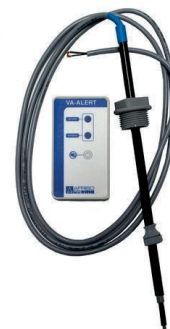
RSK nr. 563 2672

Larmet som arbetar konduktivt är avsett för avloppsvatten eller andra elektriskt ledande vätskor. Alarm ges när givarens båda elektroder omges av vätskan. Batteridrift.