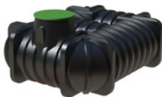
SLUTEN TANK 5 M 3 Lågbyggd