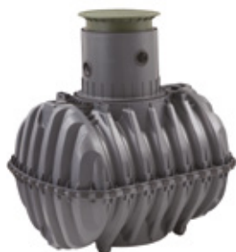
CONCLEAN GRAF SLUTEN TANK Finns i fyra storlekar

Conclean har ett brett sortiment av slutna tankar i flera olika modeller och storlekar. Exempelvis finns det lågbyggda modeller och de som tål att köras på och därför kan grävas ner vid garageuppfarter. De flesta av våra tankar finns i storlekarna 1-5 kubik, men vi erbjuder även större modeller vid behov. En större tank ger längre tömningsintervall, men kostnaden för tömning tredubblas om tanken är större än 6 kubik.