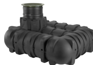
SLUTEN TANK 3 M 3 Lågbyggd